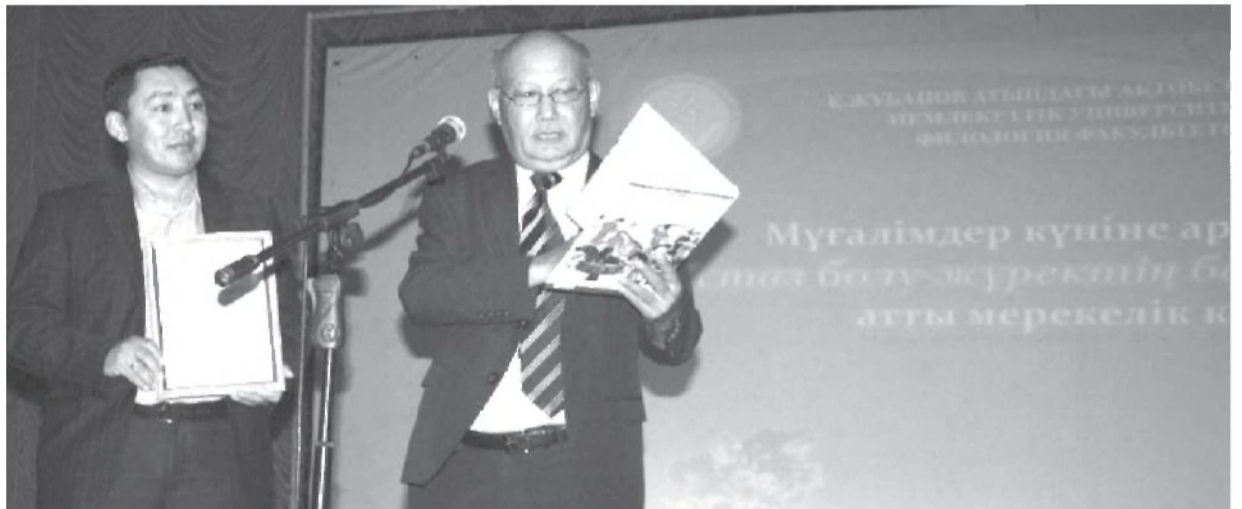
Шара барысында арнайы келген кеш қонақтары факультеттің үздік деп танылған оқытушыларына арнайы диплом мен бағалы сыйлықтар табыстады. Факультетіміздің өнерпаз студенттері ұстаздар