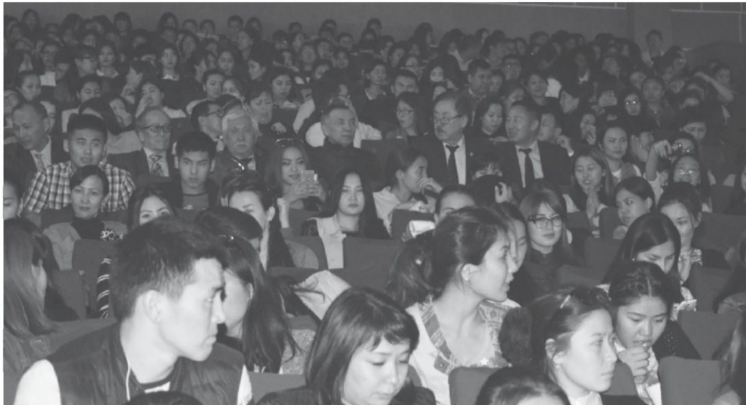
бастап қазіргі уақытқа дейінгі бастан кешірген кезеңдерін қамти білген. Нәубет жылдарындағы

Фильм желісіне келетін болсақ, жастайынан өмір тауқыметін кереген кейіпкердің тағдырымен өрбиді. Анаға деген ыстық сезім, сарғайған сағыныш, өшпейтін үміт оты фильмнің ең негізгі түйіні бола білді. Бұл фильм тек кейіпкер өмірінің қаншалықты ауыр болғандығын көрсетумен шектеліп қалған жоқ. 130 минут ішінде қазақ халқының 1930 жылдан