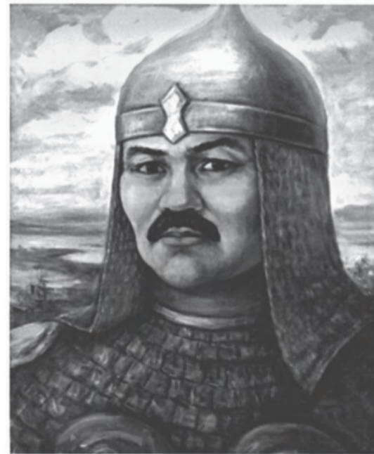
ТАБЫН БӨКЕНБАЙ БАТЫР 1667-1742 ж.ж.

Біздің батыр Бөкенбай Қараұлы туралы ғұмырнамалық, әдеби және тарихи зерттеу мақалалар жинағын