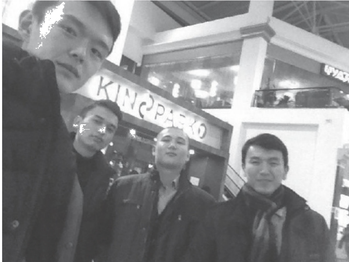
Участники команды "Gentlemen", победители научно-интеллектуальной игры "PetroLeader-2015" в кинопарке (Побег из аула: операция «Махаббат»)

шел полностью на английском языке. Несмотря на это, участники смогли понять правила первого тура и отгадать скрытые нефтегазовые термины, которые были на английском языке. Во втором туре «Эрудит» было 5 ячеек, которые назывались так: «Famous persons»,