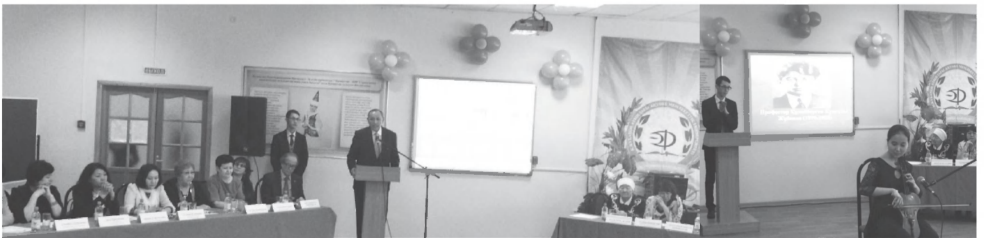
ТАБИҒАТҚА ЖАН БІТІРІП, ҚАРА ЖЕРДІ БАЛҚЫТАТЫН КӨКТЕМНІҢ АЛҒАШҚЫ АПТАСЫНДА АСЫЛ АНА, АДАЛ ЖАР, АРУ ҚЫЗ-КЕЛІНШЕКТЕРДІҢ МЕРЕКЕСІ АТАП ӨТІЛЕРІ КЕЗДЕЙСОҚТЫҚ ЕМЕС, ӨЗАРА ҮНДЕСТІК ТАПҚАНЫ ТАНҒАЛДЫРАДЫ.ОТБАСЫНАН ОТАНЫМЫЗҒА ДЕЙІН ЖҰМЫЛА АТАП ӨТЕТІН ОСЫ ХАЛЫҚАРАЛЫҚ МЕРЕКЕГЕ ӘР ҰЖЫМ ӨЗІНШЕ ҮЛЕСТЕРІН ҚОСАДЫ.

Мереке қарсаңында университетімізде шуақты шара өтті. Қ. Жұбанов атындағы Ақтөбе өңірлік мемлекеттік университетінің 50 жылдығына және Халықаралық әйелдер күні 8 наурыз мерекесіне арналған бұл мерекелік шараны «Жұбановтану» ғылыми-зерттеу зертханасы мен университеттің «Қыз парасаты» интеллектуалдық-эстетикалық клубы ұйымдастырды.