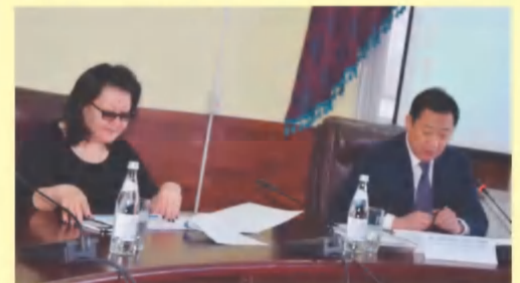
АРУ вошел в состав Международного инновационно-производственного консорциума