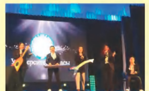
Факультетаралық КВН ойындары