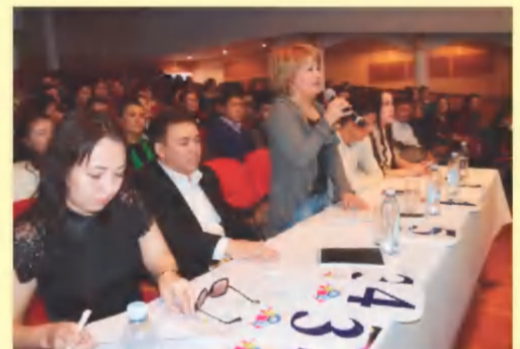
«Ескі толқын жаңғырығы» атты ретро әндер байқауы өтті