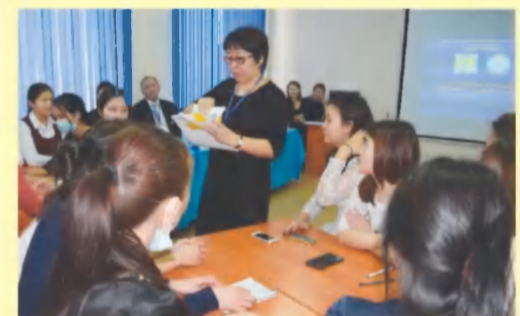
Оқу үрдісін дамытудың жаңашыл бағытында тәжірибемен алмасты