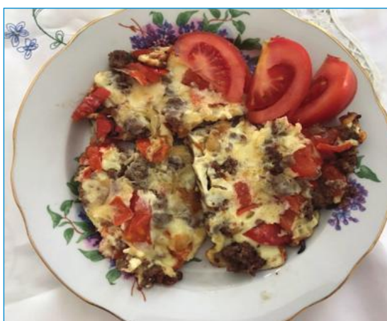
Страницу подготовила Ажаргуль Кунарова

3-яйца, 1 небольшая луковица, 100 гр. фарша любого (в нашем случае куриный), 100 гр.масло растительное, 1 небольшой помидор, 200 гр.молока, 1-2 столовой ложки муки, зелень, соль, перец по вкусу. Все эти продукты обошлись примерно 500 тенге и рассчитан на двоих.