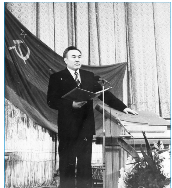
Торжественная присяга Первого Президента Республики Казахстан Н.Назарбаева (г.Алма-Ата, 10 декабря 1991 года)

билікке келуін қамтамасыз ету», - деді Н.Назарбаев үндеуінде.