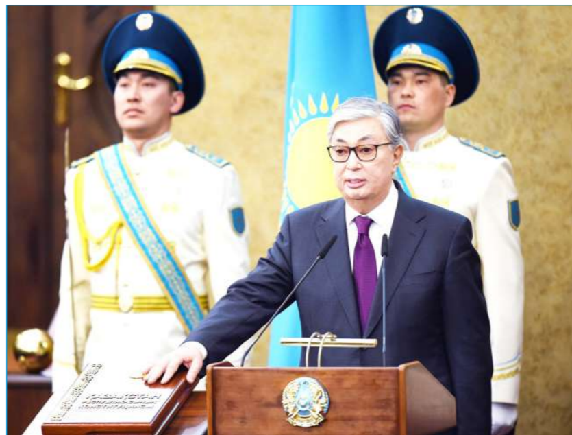
Торжественная присяга Второго Президента Республики Казахстан К.Токаева (г.Астана, 20 марта 2019 года)