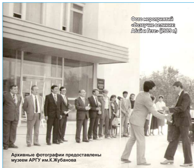
Фото мероприятия «Созвучие великих Абай и Гёте» (1989 г.)