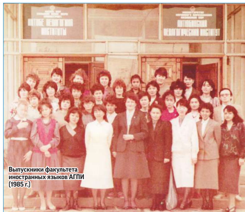
Выпускники факультета иностраных языков АГПИ (1985 г.)