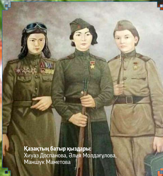
Қазақтың батыр қыздары: Хиуаз Доспанова, Әлия Молдағұлова, Маншүк Маметова

Вкусное и сытное блюдо. Приятного аппетита!